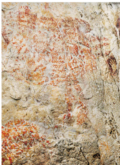
Vor 40.000 Jahren.